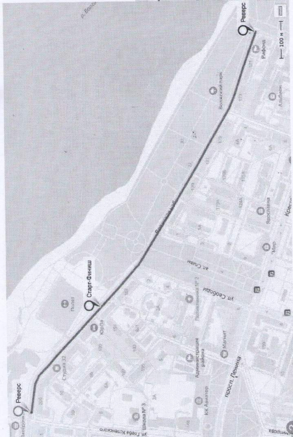
Схема маршрута на дистанции 5 км, (2 круга), 10 км (4 круга)